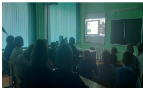
ученики МБОУ «Трудиловская СШ» 17.11.2023 г.