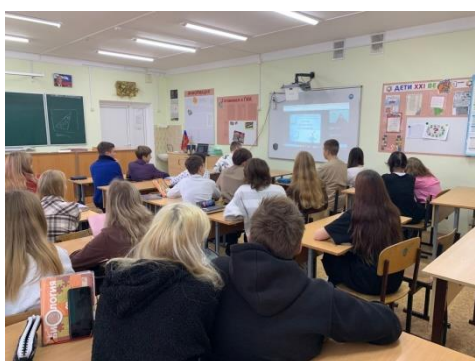
ученики МБОУ «СШ № 1» г. Рославля 17.11.2023 г.